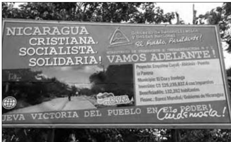
Letrero oficial que muestra el costo del millonario proyecto de adoquinado.