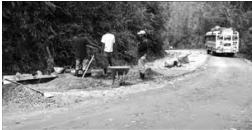
Entre las críticas hechas al proyecto está la contratación de personal no calificado.